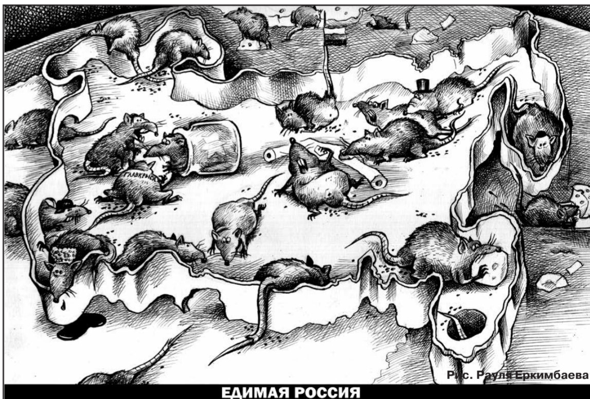
Рис. Руудь Еркимбаева

Ну и ещё добавляют нам головной боли действия самого Трампа, «заряженного» на «неожиданности» в плане глобальных финансовых реформ в США и мире, плюс дикие манёвры группы Гераченко\Иванов\Хасис с Дойчебанком (отравление Э. Моста, закрытие ДБ и перевод его активов в США) правами и аннуитетами СССР, попытки их списать в пользу нового ФРС, их конфликт с Елизаветой II и УС, ожидаемая реформа ФРС, самоубийственные «100 шагов»